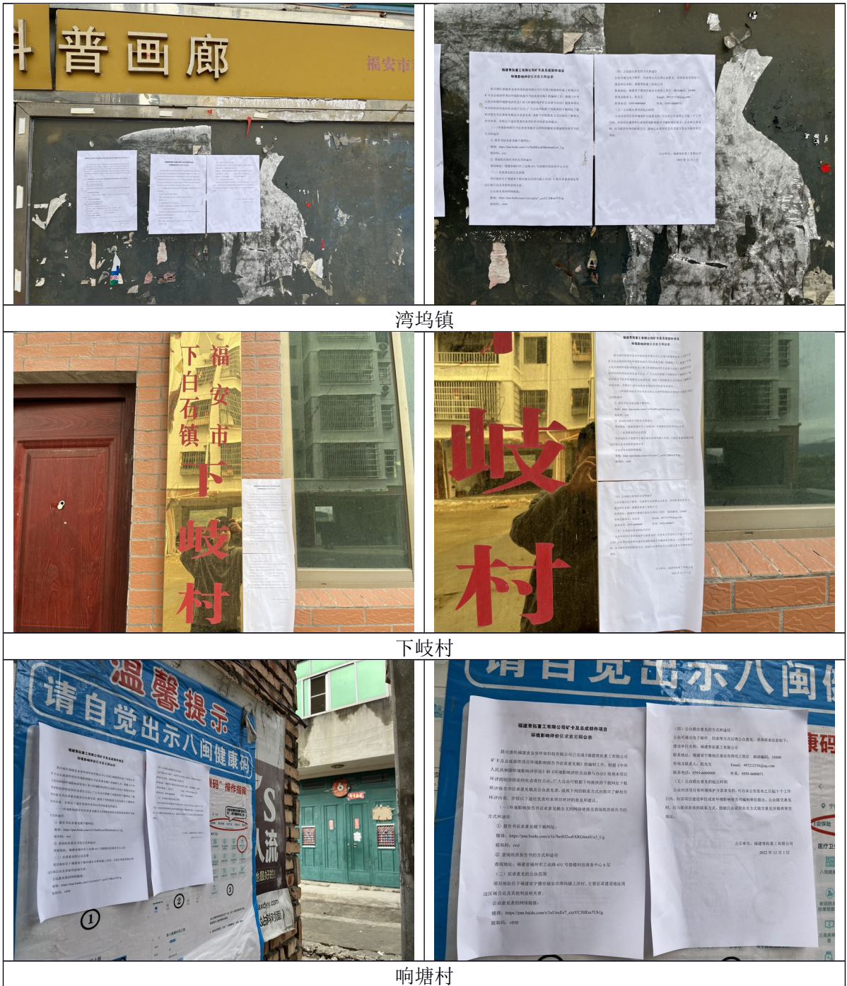
图 3.2-2 张贴公告现场